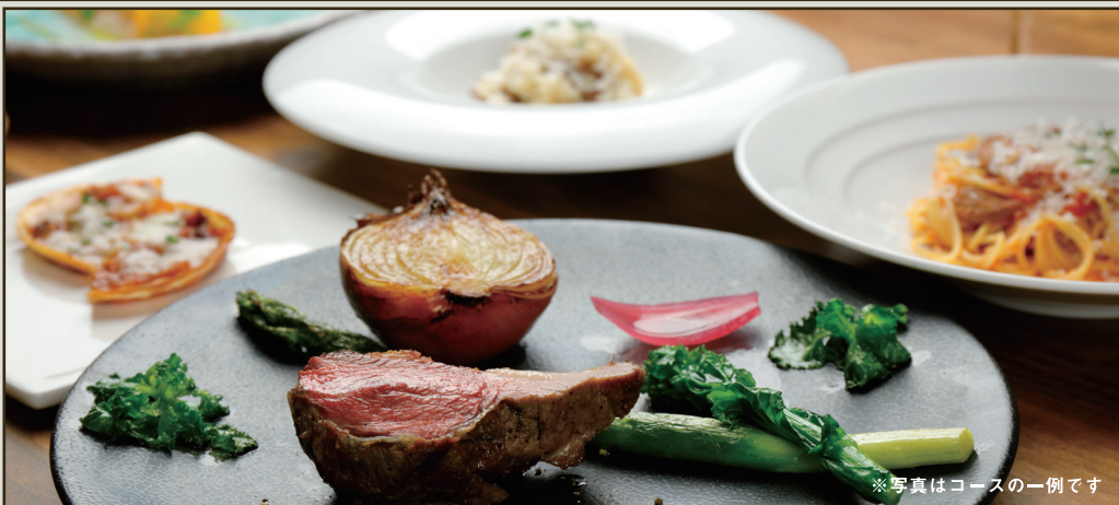
※写真はコースの一例です